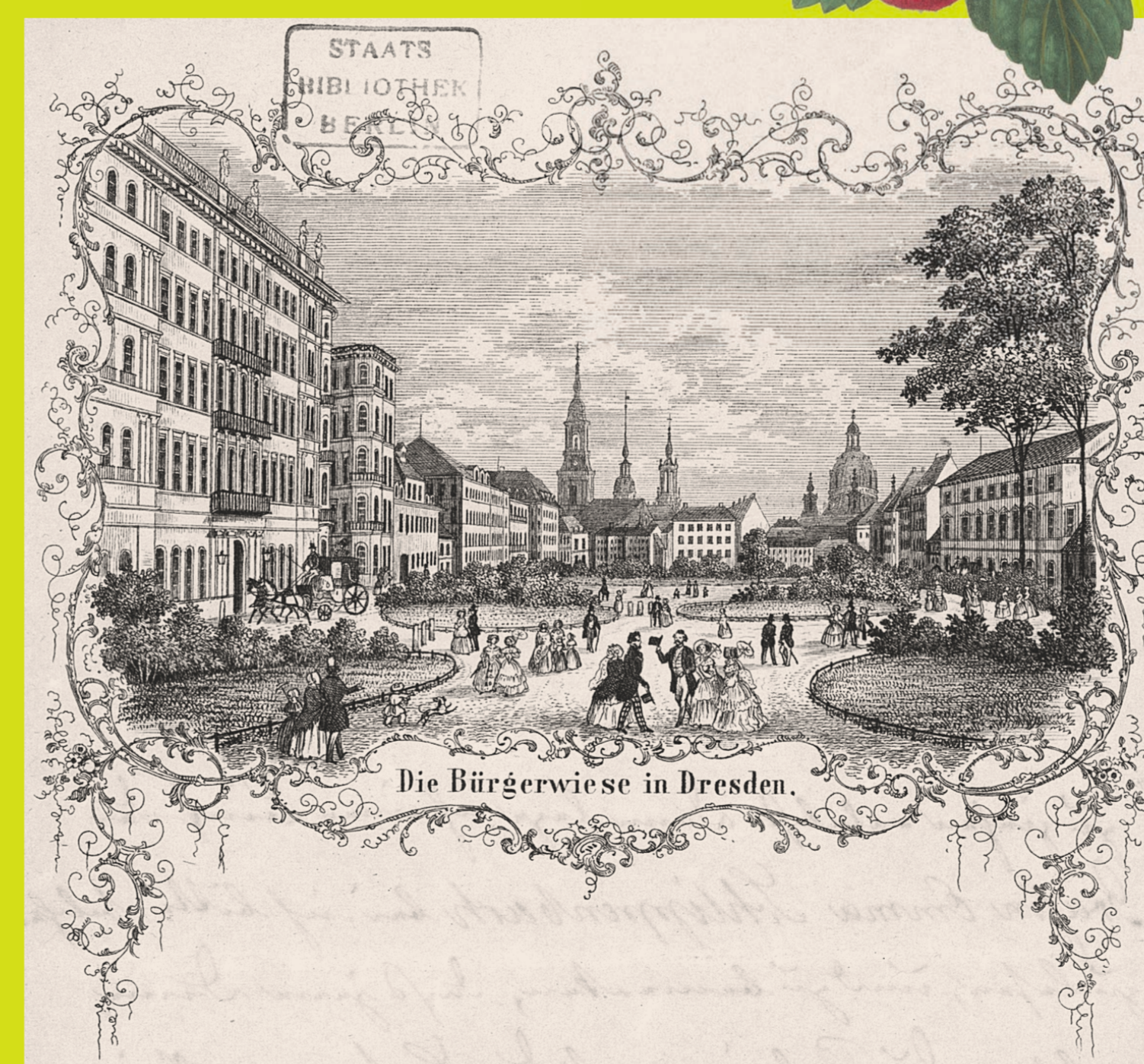
Bürgerwiese in Dresden, Abbildung auf dem Briefpapier der Fürstin, 2. März 1853

In Sichtweite des heutigen Hardenbergplatzes entstanden die neuen Gewächshäuser für die Anzucht von Ananas, Blumen und Champignons. Pückler folgte damit dem Wunsch der Fürstin, die von dem Platz hinter den Schafställen abriet, weil sie der Meinung war, dass so ein Haus mehr den Park zieren und eher in der Nähe des großen Küchengartens stehen sollte.