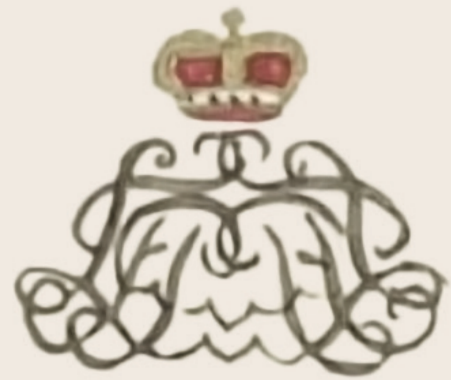
Initialen der Fürstin LFPM (umrankt mit dem Buchstaben S) auf einem ihrer Briefe 1848.

Der fürstliche Blumengärtner Wilhelm Kühnau erinnerte sich an diese Herausforderung: »Eine Schwierigkeit bot die Bepflanzung des »Kronenbeetes« eines arabeskenartigen Blumenstückes auf der Hinterfront des Schlosses, für welches die Farben goldgelb, blau, lila und rosa gegeben waren. Die Bepflanzung der Krone, der Hauptfigur dieses Beetes, mit dem wildwachsenden Sedum sexangulare [Mauerpfeffer], im Monat Juli, machte einen brillanten Effect.«