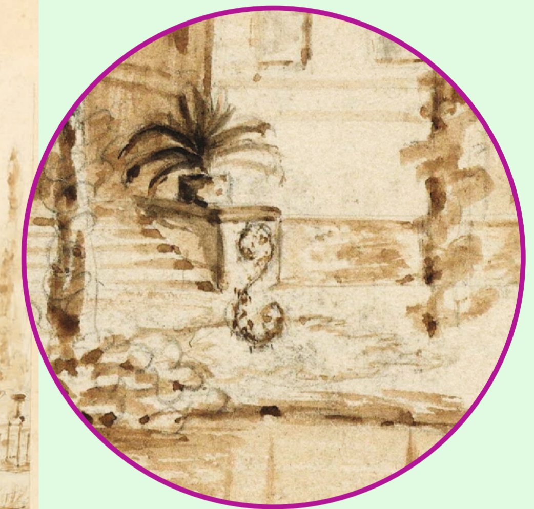
Parkseite von Schloss Branitz, Pleasureground mit Schnucke-S, Aquarell um 1860.