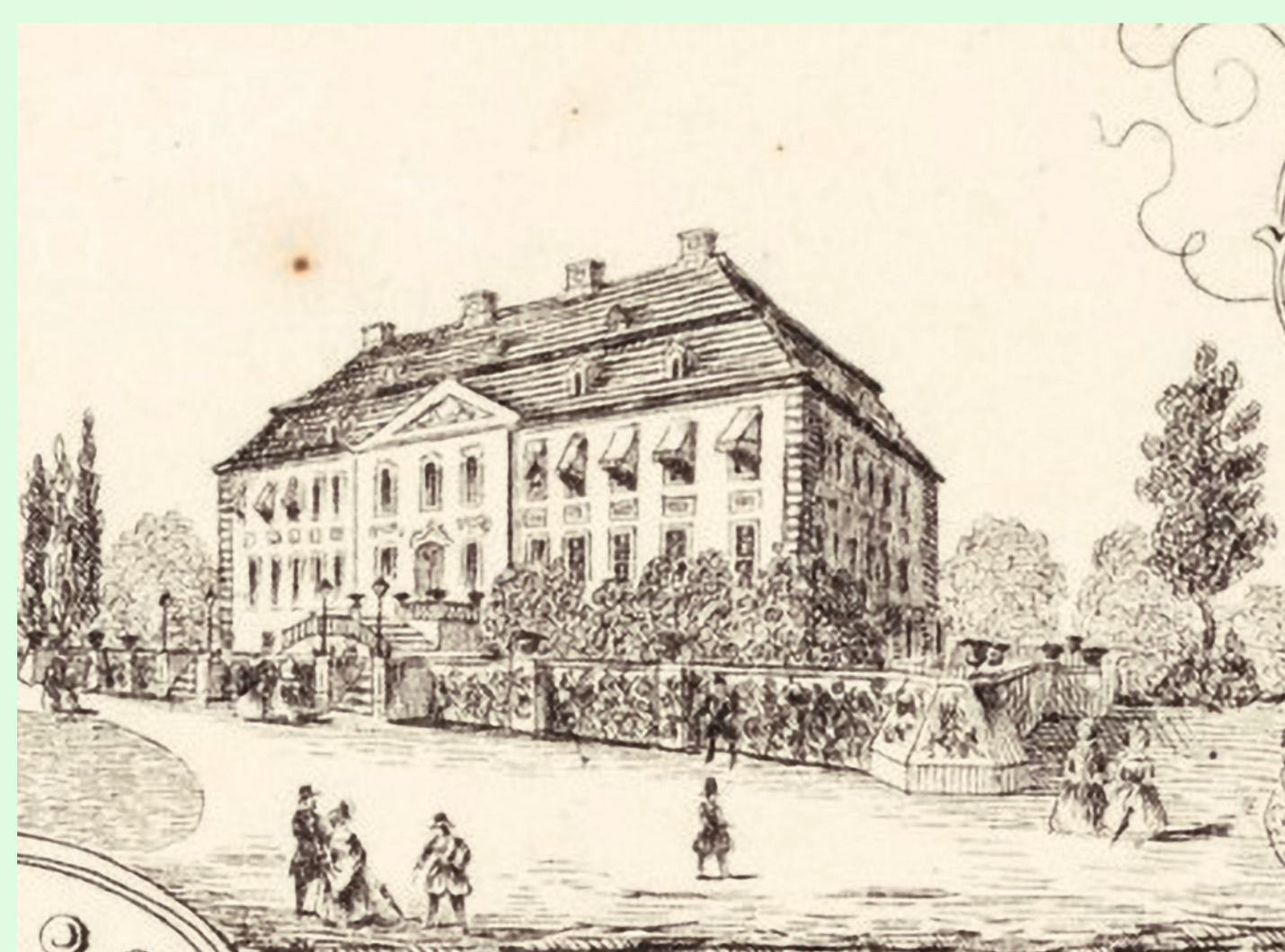
Schloss Branitz, aus: Plan des Fürstlich Pückler-Muskauschen Parks zu Branitz, 1853. © SFPM

Kamelien und Rhododendren schmückten ab 1850 die Schlossterrasse. Oben: Rhododendron Ponticum, aus: Flore des Serres et des Jardins de l'Europe, Bd. 5, 1849. © SFPM Unten: Kamelie (Camellia japonica Grande Duchessa d'Etruria), aus: Flore des Serres et des Jardins de l'Europe, Bd. 2, 1846. © SFPM