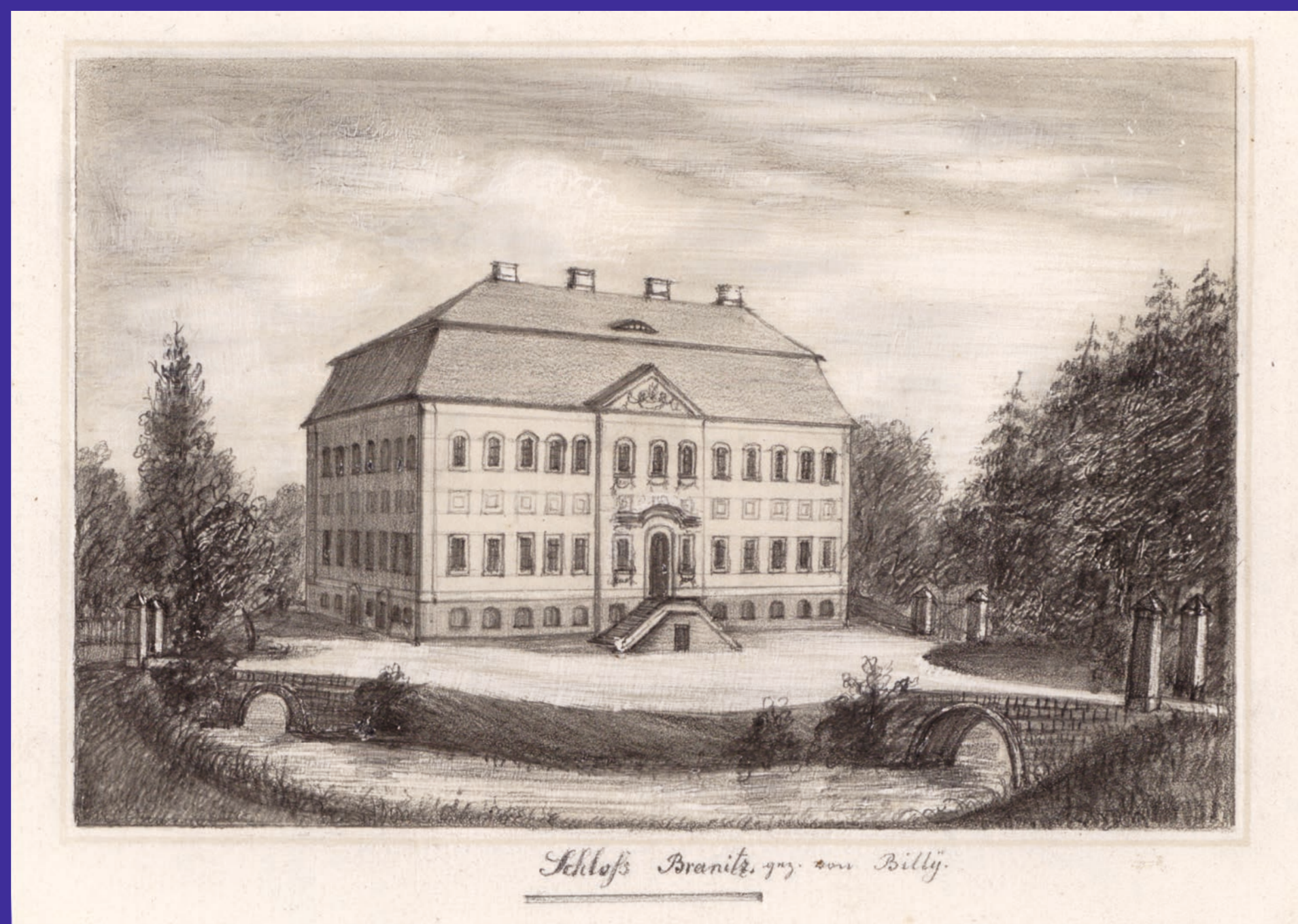
Schloss Branitz bei der Ankunft der Fürstin 1845, Zeichnung von ihrem Diener Wilhelm Heinrich Masser.